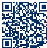
Gewichtungstabellen und Kriterienkataloge (DGNB GmbH)

Alle erforderlichen Unterlagen sind digital bei der DGNB GmbH ( dgnb.de/dgnb-sonderauszeichnung-umweltzeichen ) und der HafenCity Hamburg GmbH ( hafencity.com/umweltzeichen ) abrufbar bzw. können dort angefordert werden.