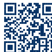
Weitere Informationen (HafenCity Hamburg GmbH)